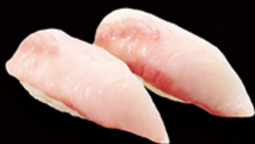
福井 朝獲れ ほうぼう