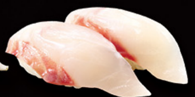
福井 朝獲れ めじな