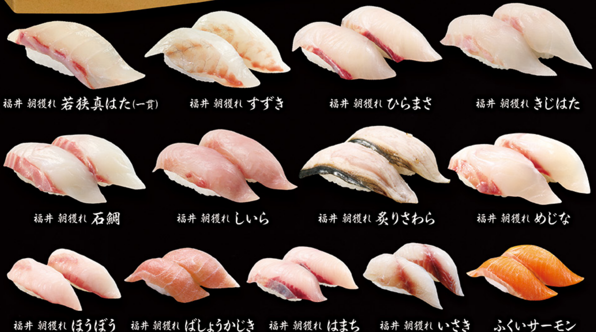
福井 朝獲れ 若狭真はた(一貫)