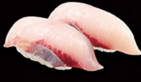
福井 朝獲れ はまち