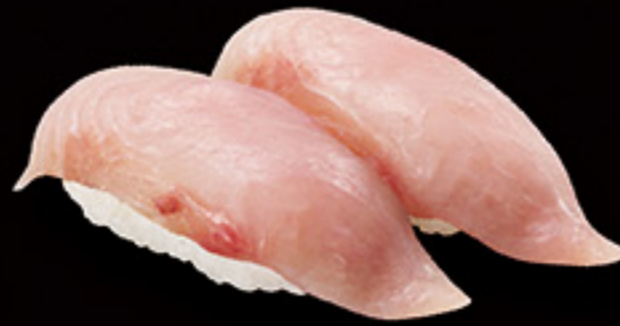
福井 朝獲れ しいら