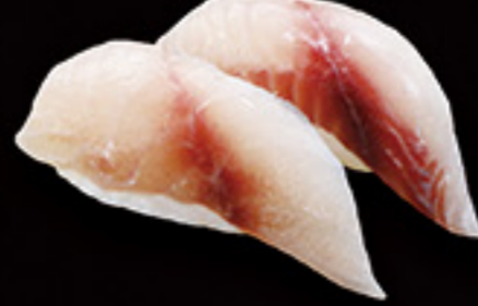
福井 朝獲れ いさき