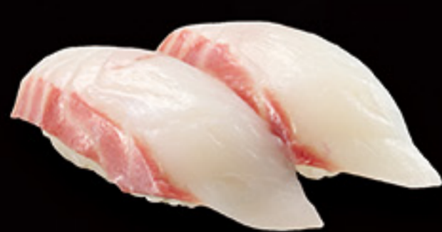
福井 朝獲れ 石鯛