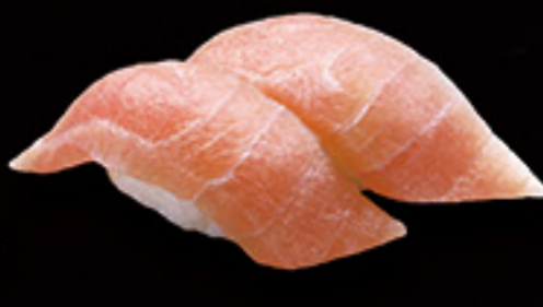
福井 朝獲れ ばしょうかじき