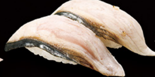
福井 朝獲れ 炙りさわら