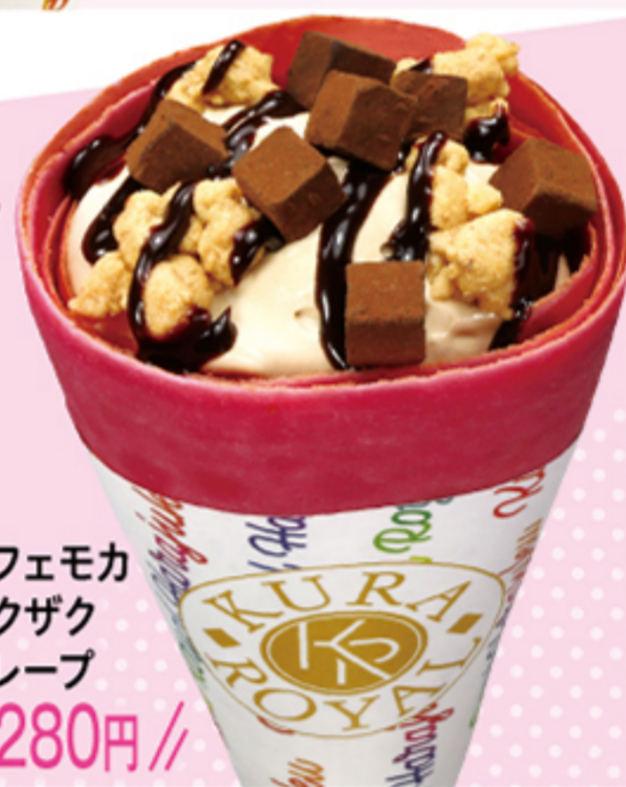
カフェモカ ザクザク クレープ \\280円\\