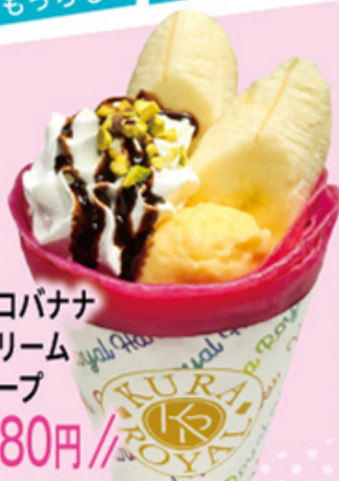
チョコバナナ Wクリーム クレープ \\380円\\