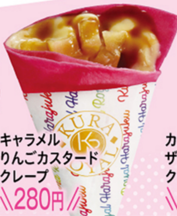
キャラメル りんごカスタード クレープ \\280円\\