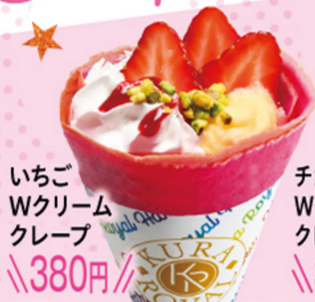
いちご Wクリーム クレープ \\380円\\