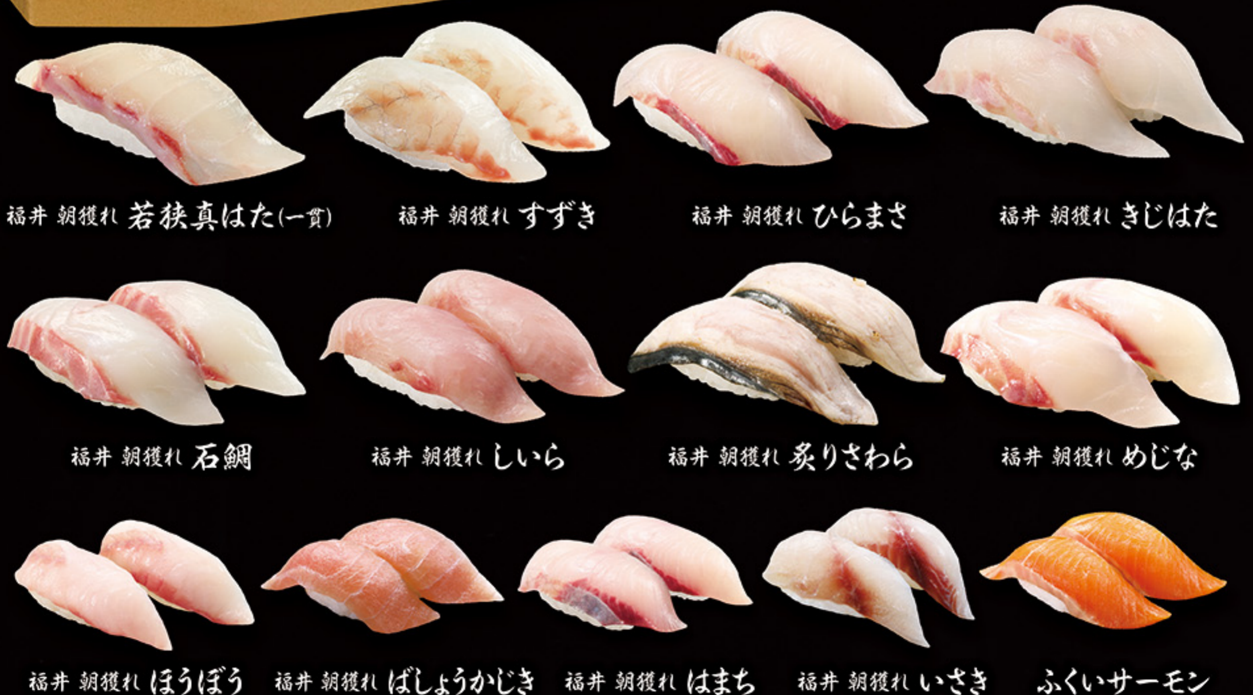
福井朝獲れ 若狭真はた(一貫)